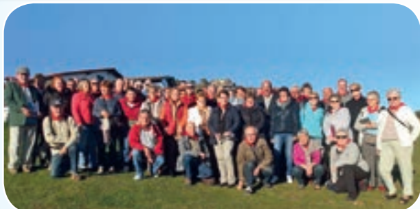
Certainement une riche expérience à renouveler, tout le monde fut ravi.