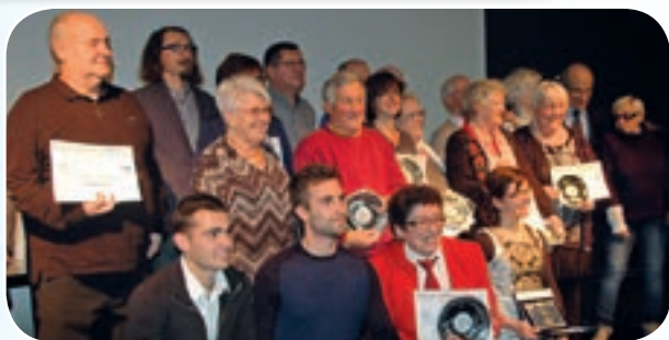
Les bénévoles récompensés