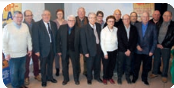
Le nouveau comité directeur nouvellement élu