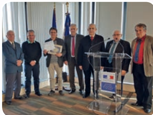
Les Amis de la Forge Liboz ( Jura )