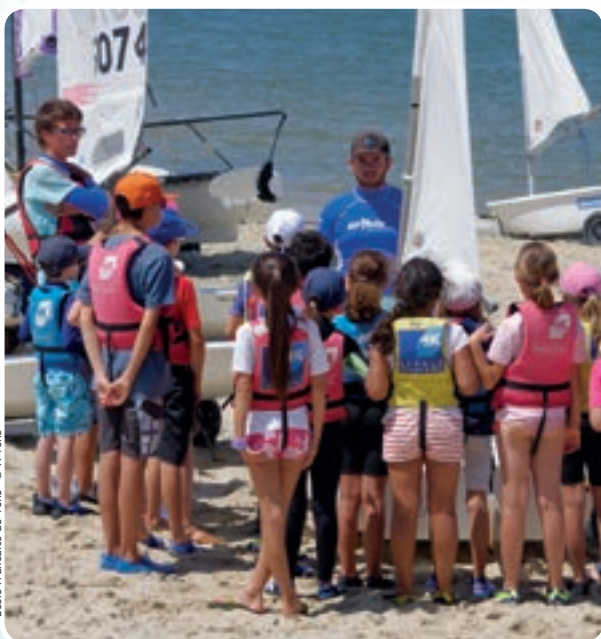
Ecole Française de Voile